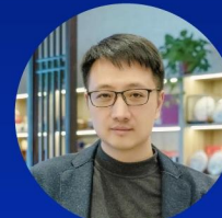
人力资源博主 @夏至工作室