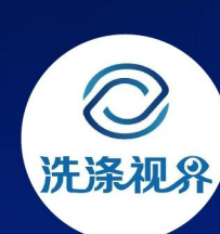
VOLUME PRESS主理人 @NELSON