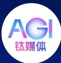
诸事即兴主理人 @鸡毛