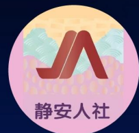
城市融媒体 @静安人社