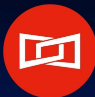
新闻媒体 @界面新闻