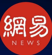
新闻媒体 @网易新闻