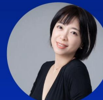
职场博主 @大湾区一姐