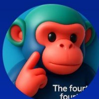
知名AI博主 @第四种黑猩猩