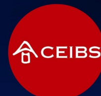
商学院 @中欧创投营